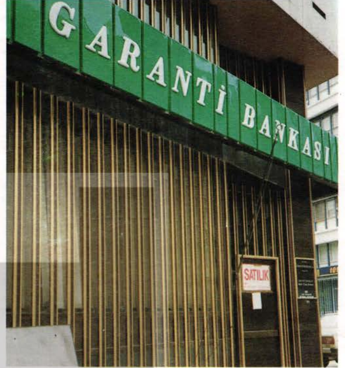
Geçtiğimiz yıllarda İngiltere'de yaşanan süreç şimdi ülkemizde de yaşanıyor... Önce işçiler atılıyor, sonra şubeler satılıyor. Garanti Bankası İzmir Halit Ziya Şubesi, kapısındaki SATILIK ilanı ile bunun en somut örneği...

Yeni teknolojiyle birlikte müşteriyle bankacı arasındaki insani ilişkinin yerini, müşteriyle makina arasındaki mekanik ilişki alıyor. Büyük Britanya finans endüstrisindeki makinalara bağımlı olarak ortaya çıkan iş ve hizmet kesintileri, müşterilerce de hissediliyor.